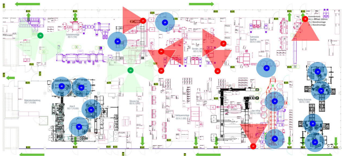
Abbildung 2: Kamerapositionen im Bereich Reinraum BiMOS BE, Ebene 3 (Status 10.11.2021)